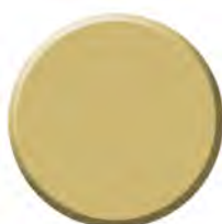
Beige Disponible en M4