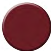
Bordeaux Disponible en M4